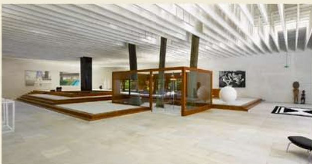
Elmgreen & Dragset, The Collectors: The Nordic Pavilion , 2009